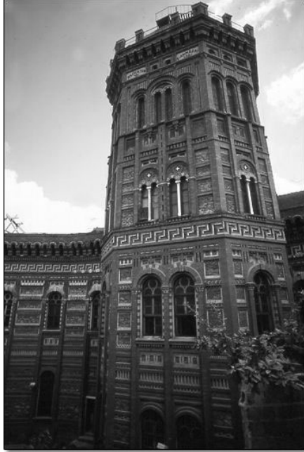
Yandaki Resim: Fener Rum Patrikhanesinden bir görünüş.

İki kilise arasındaki bu çekişme Bizans'ı da yıpratmıştır. Özellikle Bizans 1400'lü yıllarda Türk tehlikesini hissetmiş ve çevreden yardım alma gereği duymuştur.1439 yılında bu sefer Floransa'da konsil toplanmıştır. Birçok konunun tartışıldığı bu konsilde üstünlük Vatikan'dadır. Bir kısım düşünürler, Ortodoks kilisesinin kurtuluşunun ancak Türk egemenliğinin kabul edilmesi ile mümkün olacağını kabul etmiştir. 8 Zamanla da Türk hâkimiyetinden kurtulacaklarını planlamışlardır. Bu düşünce Ortodoks ve Katolik toplumların birbirine olan büyük düşmanlığını göstermektedir.