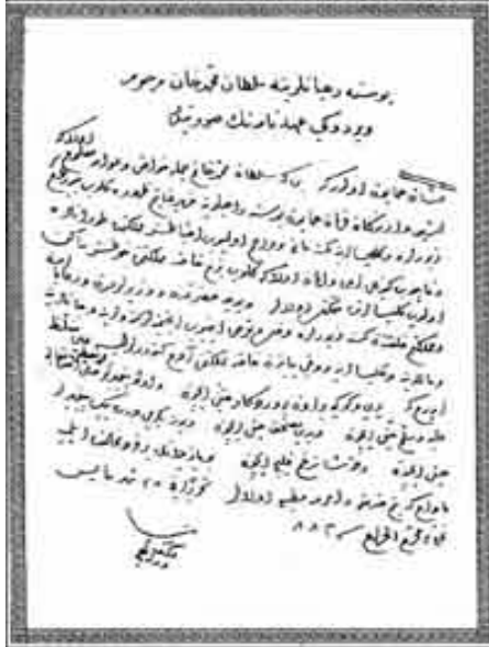
Yandaki Resim: Fatih Sultan Mehmet'in Bosna'nın fethedilmesi ardından bölge halkının dini serbestiyetini kanunlaştıran berâtı. (1468)