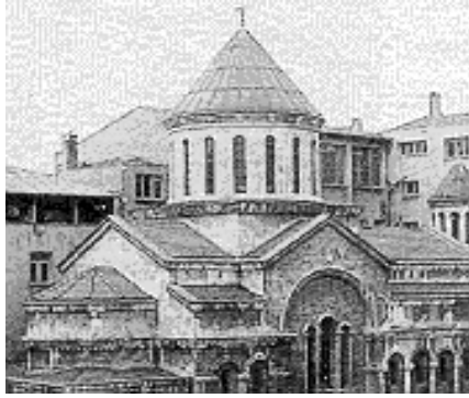
Yandaki Resim: Ermeni Ortodoks Kilisesi, İstanbul.

Lozan antlaşmasından önce patrikler, patriklik esası ile beraber başlarına da Konstantin'in saltanat alameti olan ve pençesinde küre-i arzı tutan pırlantalı Bizans İmparatorluğu tacını giymekteydiler. Siyasi bir iddia taşıyan bu alametlerin, Lozan'dan sonra terki gerekirken patrik bu taci taşımakta devam ettiği gibi, Bizans İmparatorluk kilisesi teşkilatına uygun olarak metropolitlikleri hala muhafaza edilmiştir. Piskoposların yakalarını da Bizans arması süslemiş ve bütün metropolitler ayinlerde başlarına çift kartallı Bizans arması ihtiva eden taçlar giymeye devam etmişlerdir. 36