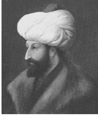
Yandaki Resim: Fatih Sultan Mehmet.

1453 yılında İstanbul'u fethederek başkent yapan Fatih Sultan Mehmet burada çok sayıda Rum Ortodoks'un yaşadığının bilincinde ve patrikhanenin öneminin farkında olup patriklik makamına yüz yüze görüştüğü Cennadios'u getirmiştir. Bir fermandan, patrikhaneye önceden sahip olduğu haklardan daha fazlasını vererek ona özerk bir statü kazandırmıştır. Fatih'in tek istediği, bir daha kesinlikle Vatikan ile birleşme çabasına girilmemesidir. Zaten seçtiği Cennadios da birleşme karşıtıdır. 12